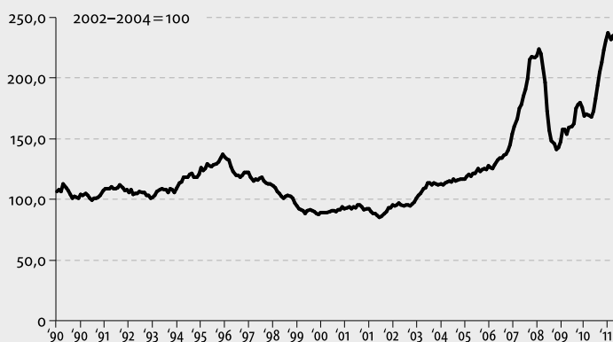
Abb. 1: FAO-Preisindex für Lebensmittel (1990–2011)

Besonders wuchsen sogenannte Indexfonds, in denen 2003 nur 15 Milliarden US-Dollar angelegt waren, 2008 schon 200 Milliarden. 7 Dies sind Fonds, die einer Futures-